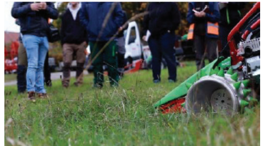
Bild 2: Die Teilnehmenden des Lehrgangs zum/zur Geprüften Natur- und Landschaftspfleger/in machen sich mit den verschiedenen Mähetechniken vertraut

Bild 1: In der Technikwoche des Lehrgangs zum/zur Geprüften Natur- und Landschaftspfleger/in wurden verschiedene Gerätschaften zur insektenfreundlichen Mahd vorgestellt