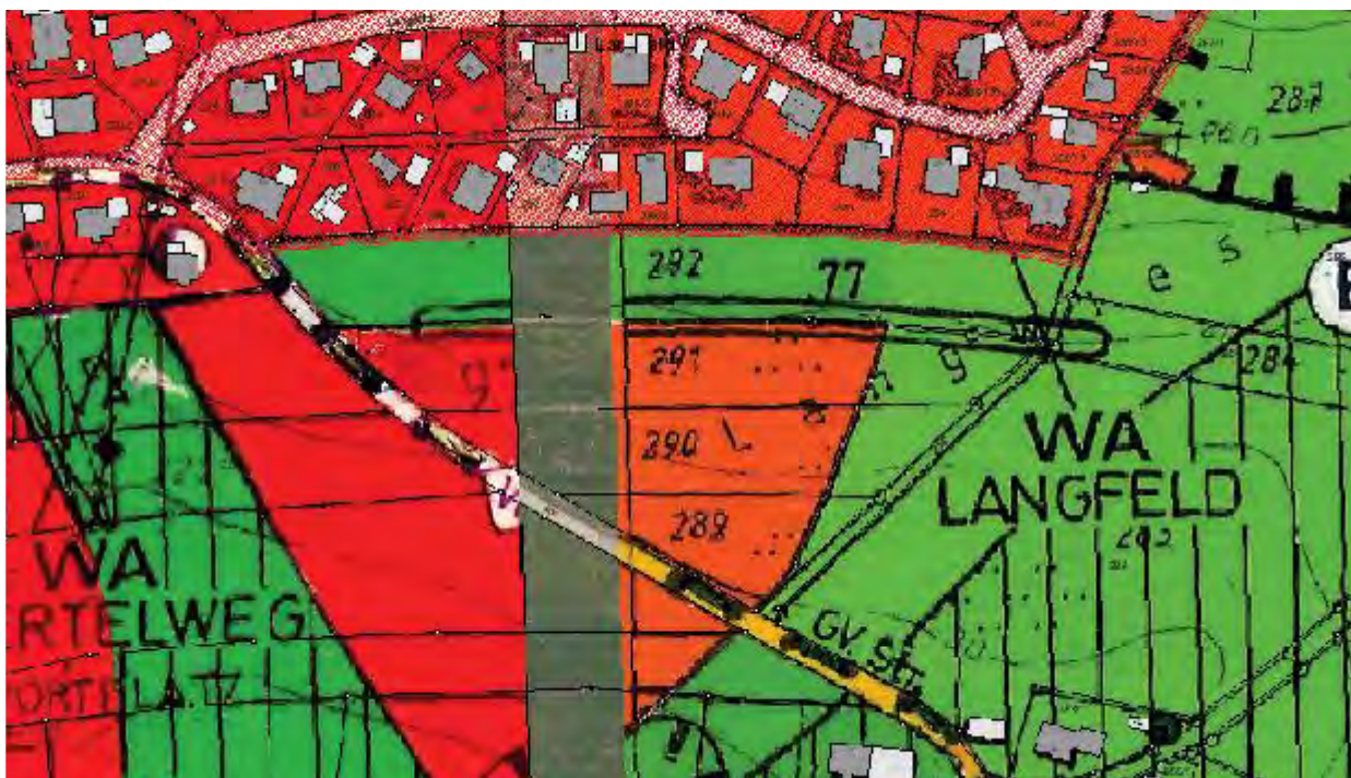
Auszug aktueller Flächennutzungsplan

Der Flächennutzungsplan ist in diesem Bereich derzeit noch als Grünfläche ausgewiesen, die Änderung ist jedoch bereits beantragt und wird im Juni 22 genehmigt. Die vorgesehene Ausweisung als Allgemeines Wohngebiet (WA) wird damit im Zuge des Verfahrens angepasst.